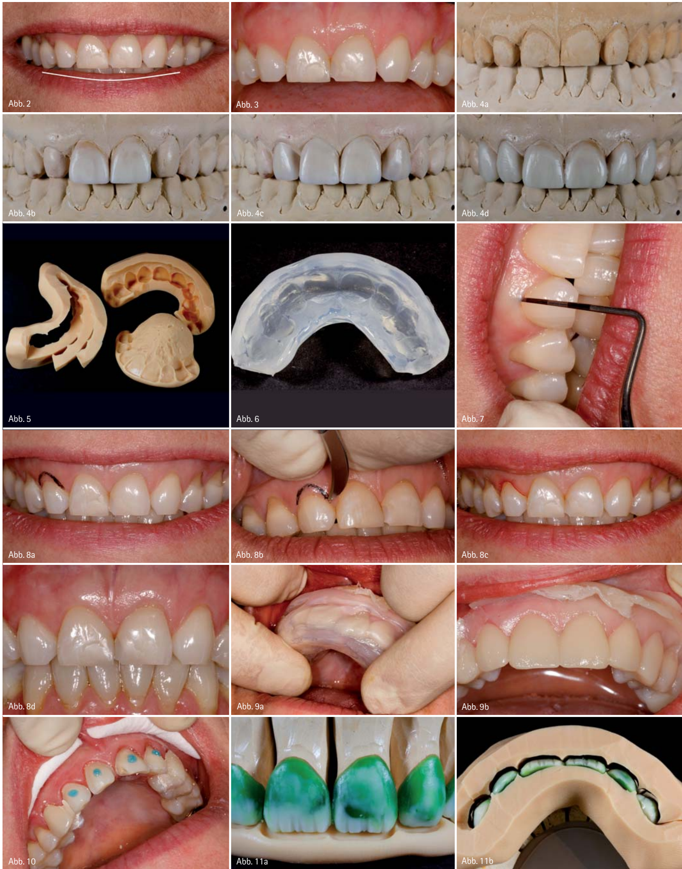
Abb. 2: Die Längen der Oberkieferfrontzähne folgen nicht dem Verlauf der Unterkieferlippe, durch die starke Abrasion ging die natürliche „Smileline“ verloren. – Abb. 3: Umgekehrte „Smileline“ der Oberkieferfront. – Abb. 4a–d: Situationsmodell (4a) und Anfertigung des Wax-ups. – Abb. 5: Silikon Schlüssel als Präparationshilfen. – Abb. 6: Silikon Schlüssel aus klarem Silikon zur Herstellung des Provisoriums. – Abb. 7: Messen der Sulkustiefe. – Abb. 8a–d: Behandlungsablauf der Gingivektomie und das Ergebnis nach drei Tagen im Bild unten rechts. – Abb. 9a–b: Herstellung des Provisoriums. – Abb. 10: Punktuell Anätzen der präparierten Zahnoberfläche zum Einsetzen des Provisoriums. – Abb. 11a–b: Platzkontrolle der Modellation mithilfe der Präparationshilfen.